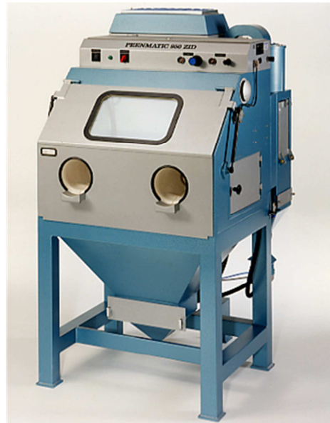
Abbildungen können Zubehör und / oder Spezialausführungen enthalten